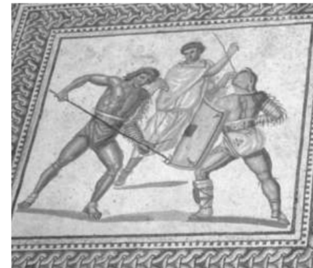
Retiariuse ja secutori võitlusstseeni kujutav detail Nennigi külas asuvast Rooma põrandamosaaligist

Trier oli üks suurimaid linnu tolle-aegses maailmas. Hiilgeaegadel arvatakse olevat seal elanud 100 000 elaniku, sama palju kui tänapäeval. Praeguse mõistes oli Trier seega miljonilinn.