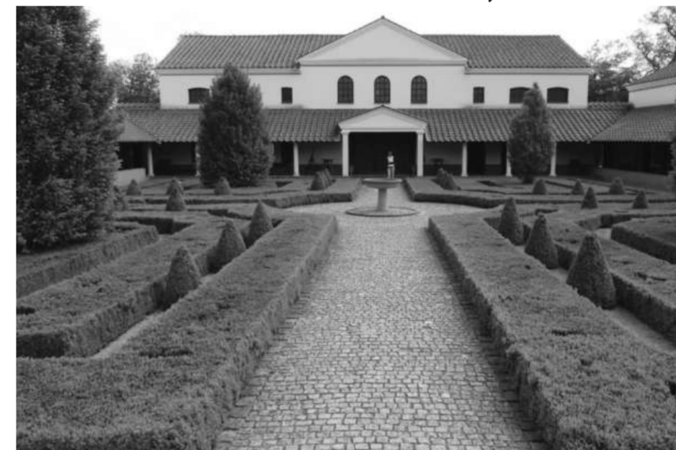
Rooma villa rekonstruksioon Borgis, Moseli Saksamaa-poolsel kaldal

Luksemburgi sünnipäevaks peetakse 963. aastat, kui mõjuvõimas Ardenide krahv Siegfried I (elas aastatel 922-998) omandas palmipuudepühalt vahetuskaubana Trieri St. Maximini kloostrilt Alzetti jõe kohal kõrguva Lucilinburhuci kalju koos seal asuva väikese vahitorniga. See feodaalmaade vahetuskaupa kinnitav dokument oli esimene kord, mil kirjalikult mainiti Luksemburgi nime. Luksemburgi sünnitunnistuse originaali säilitatakse Trieris.