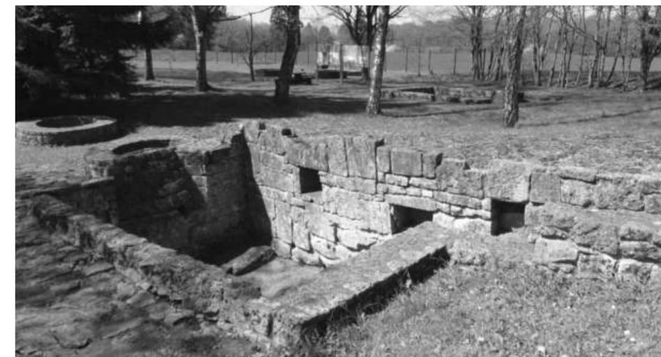
2500 aasta vanuse keldi küla väljakaevatud varemed suurimal Luksemburgis leitud keldi asualal, Titelbergi platool. See asub Rodange'i lähedal

Aga 1340. aastal toimunud sündmus röömustab meid tänaselgi päeval. Nimelt siis toimus esimene suur aastalaat Schueberfouer. Luksemburgi krahviriiigist sai hertsogiriik Wenceslaus I valitsemise ajal 1354.