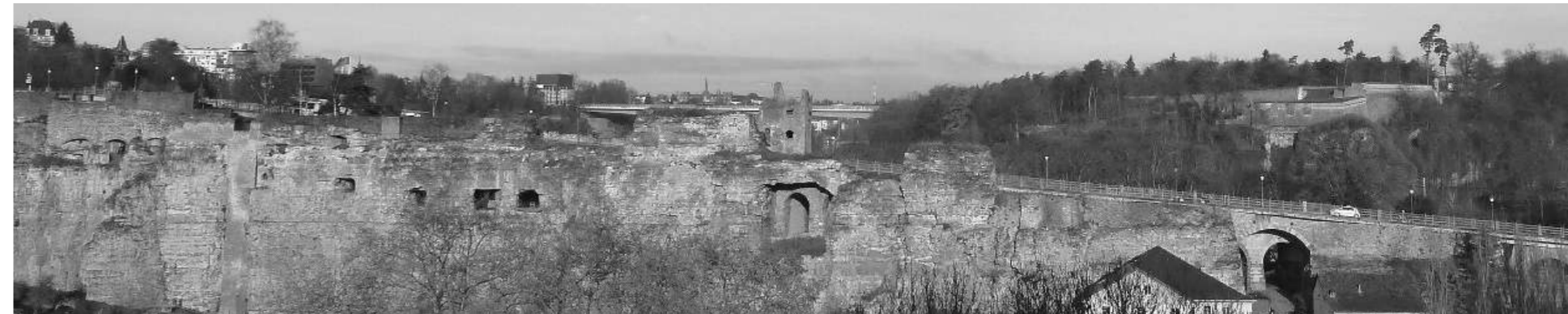
Siit Bocki kaljult sai alguse Luksemburg

Soovitan seda raamatut nii täiskasvanutele kui lastele, ühtviisi lõbus on seda lugeda kõigil.